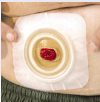
Zdj. 7 Zdejmujemy papier ochronny z elastycznego kołnierza hydrokoloidowego i przyciskamy kołnierz do skóry.