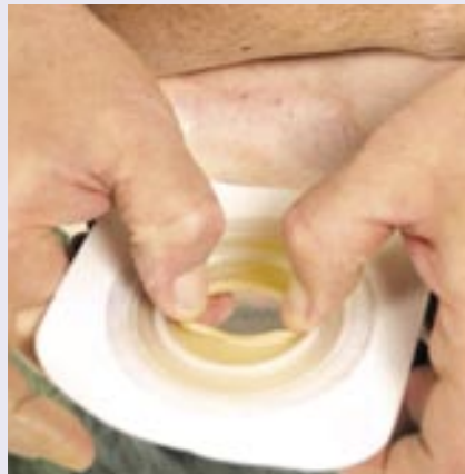
Zdj. 2 Modelujemy palcami materiał płytki tak, by jej otwór był zbliżony do wielkości i kształtu stomii.