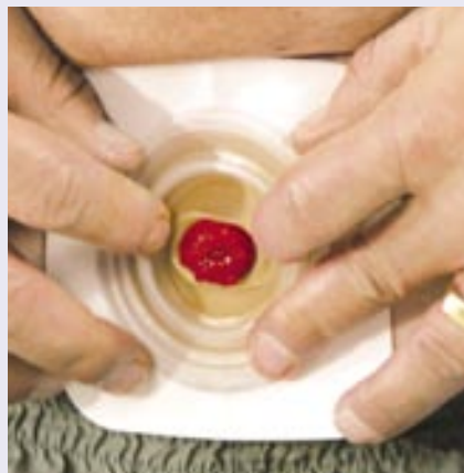
Zdj. 5 Palcami delikatnie przyciskamy płytkę, żeby ściśle przylegała do stomii.