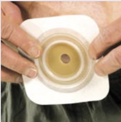
Zdj. 1 Przed nałożeniem płytki należy przyłożyć ją do stomii, aby ocenić, jak dużo materiału Stomahesive należy uformować.