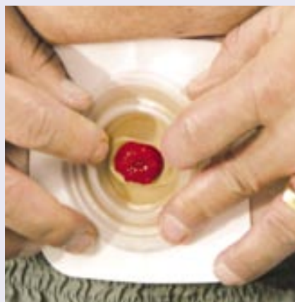
Zdj. 5 Palcami delikatnie przyciskamy płytkę, żeby ściśle przylegała do stomii.