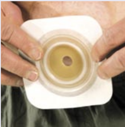
Zdj. 1 Przed nałożeniem płytki należy przyłożyć ją do stomii, aby ocenić, jak dużo materiału Stomahesive należy uformować.