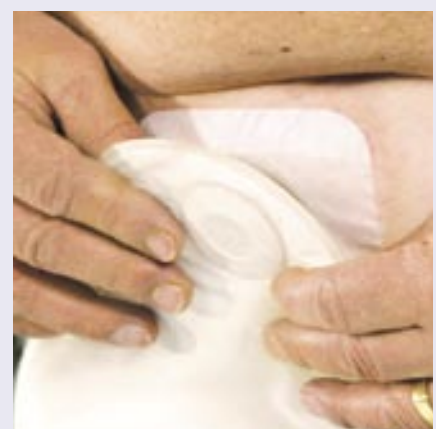
Zdj. 9 Mocujemy worek do płytki, rozpoczynając od dołu i posuwając się ruchem okrężnym ku górze. Powinniśmy usłyszeć kilka kliknięć.