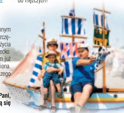
Z rodziną podczas wakacji

Nie ukrywałam. Gdy pomyślałam sobie, że z tym człowiekiem mogłabym spędzić resztę życia, powiedziałam szczerze o wszystkim. Wysłuchał mnie spokojnie i powiedział: „No i co z tego”. Czyż nie mam szczęścia do mężczyzn?