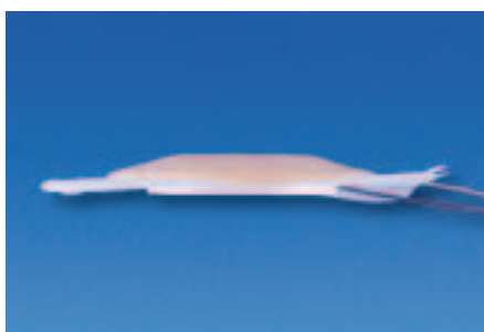
Płytki Convex z boku

Płytki Convex to płytki szczególnie zalecana do przetoki wklęsłej. Wyglądem przypomina płytkę fizelinową Flexible, z tą różnicą, że od pierścienia, na którym mocuje się woreczek, do środka płytki część przylepna jest wypukła i ma gotowy, fabrycznie wycięty otwór na przetokę. Wypukłą część płytki Convex