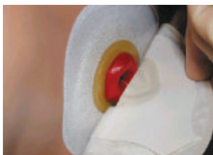
Ryc. 6. Esteem synergy™ – sposób mocowania worka do płytki (technologia połączeń adhezyjnych)

Sprzęt synergiczny łączy w sobie zalety sprzętu jedno- i dwuczęściowego. System Esteem synergy™ jest bardzo cienki, co gwarantuje komfort użytkowania oraz dyskrecję – takie jak w przypadku sprzętu jednoczęściowego. Dzięki