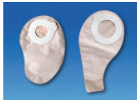
Ryc. 7. System Esteem synergy™ – worek kolostomijny i ileostomijny

Kluczową zaletą systemu Esteem synergy™ dla nowo operowanych pacjentów jest fakt, że do przyklejenia i odklejenia worków nie trzeba używać dużo siły, dzięki temu powłoki brzuszne po operacji nie są narażone na zbędny nacisk, a pacjenci na ból. Siła potrzebna do założenia worka na płytkę w systemie Esteem synergy™ jest bardzo mała w porównaniu z siłą, jakiej należy użyć, aby zmienić worek w tradycyjnych systemach dwuczęściowych. To powoduje, że Esteem synergy™ może być stosowany u wszystkich pacjentów po operacji wylonienia stomii.