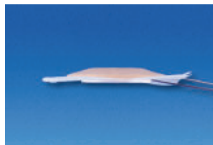
Ryc. 4. Płytki typu Convex systemu Combihesive® 2S

Osoby bardzo szczupłe, a także pacjenci z przepukliną wokół stomii powinni zastosować płytkę elastyczną i miękką – np. płytkę Flexible. Jeżeli stomia jest wklęsła lub znajduje się w fałdzie brzusznej, wskazane jest stosowanie płytek typu Convex (Ryc. 4.).