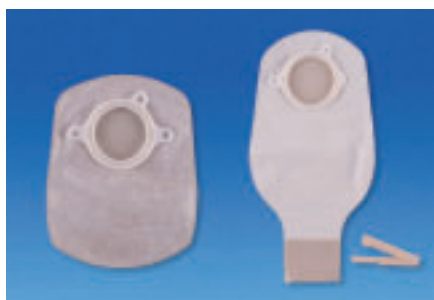
Ryc. 2. System dwuczęściowy Combihesive® 2S – worek kolostomijny i ileostomijny z zapinką

Zaletą sprzętu dwuczęściowego jest bezpieczeństwo i skuteczna ochrona skóry wokół stomii. Wykonana z materiału Stomahesive® płytka systemu dwuczęściowego pozostaje na skórze przez kilka dni, co chroni przed podrażnieniami. W tym wypadku pacjent zmienia tylko worki. Przykładem sprzętu dwuczęściowego jest system Combihesive® 2S (Ryc. 2-4.).