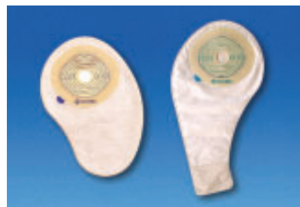
Ryc. 5. System Esteem® – jednoczęściowy worek kolostomijny i ileostomijny

Sprzęt jednoczęściowy, np. Esteem® lub Stomadress®, jest cienki, niewyczuwalny przez ubranie i bardzo dyskretny (Ryc. 5.). Worki kolostomijne zaopatrzone są w filtry wykonane