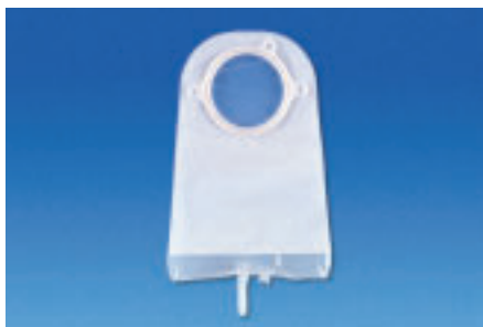
Ryc. 1. Worek urostomijny systemu dwuczęściowego Combihesive® 2S

Przy kolostomii najlepszym rozwiązaniem jest worek zamknięty z filtrem. Przy ileostomii – worek otwarty. Dla pacjentów z urostomią – worek z kranikiem umożliwiającym swobodny odpływ moczu (Ryc. 1.).